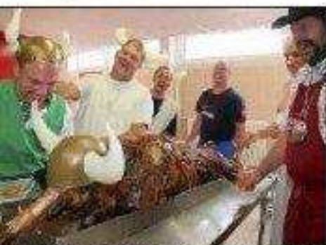
La fête du sanglier en septembre est l'un des temps forts des animations des Seniors singliers parois Porceletaires.

Ris gourmands et gais jurons, la quinzaine de membres de la confrérie du sanglier de Porcelette ont soufflé les dix bougies de leur association, la bande, dont l'objectif est de véhiculer un certain art de vivre à travers les produits du terroir, participe activement à l'animation de la localité. Elle organise des marches gourmandes, la Fête du sanglier en septembre, est représentée lors des différents chapitres des confréries de la région Nord-Est.