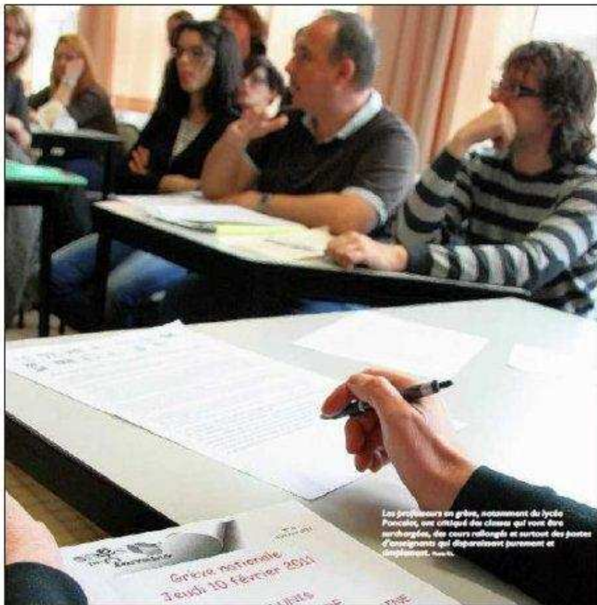
Les professeurs en grève, notamment au lycée Poncelet, ont critiqué des classes qui vont être surchargées, des cours rallongés et surtout des postes d'enseignants qui disparaissent purement et simplement.

La réforme scolaire pour les élèves de 1 er devient réalité avec la Dotation horaire globale qui vient de tomber. Au lycée Poncelet de Saint-Avoid, où 200 heures de cours ont été supprimées pour seulement 52 élèves "perdus", l'heure était à la grève. Et aux commentaires de décisions jugées « aberrantes ».